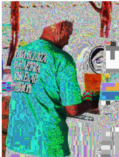
FAKAOFO, TOKÉLAOU, OCTOBRE 2007 Un habitant dépose son vote lors du second référendum des Tokélaou sur l'autonomie en libre asso- ciation avec la Nouvelle-Zélande.

de la Nouvelle-Zélande, ont organisé deux référendums afin de décider de leur statut futur. Dans les deux cas, le seuil de la majorité des deux tiers requis pour que les Tokélaou obtiennent le statut d'autonomie en libre association avec la Nouvelle-Zélande a été manqué de peu. En 2020, les Tokélaou demeurent donc inscrites sur la liste des territoires non autonomes. Depuis lors, elles s'occupent de la gestion de plusieurs